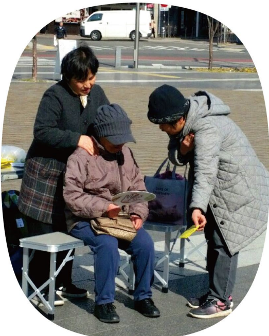
▲松本駅前にてBHPを伝えています

ブレイン体操を続けることで、体、心、脳に変化が起こり、ネガティブからポジティブになり、心の平安が得られて幸せな気持ちになりました。私は、岡谷市に住んでいるので、地元岡谷市の人たちにもブレイン体操を伝えてお役に立ちたいと思います。ブレイン体操をすることで、体、心、脳が元気になって、地域の皆さんと健康、幸せ、平和な社会を創っていきたくらい、ブレイントレーナーになりました。