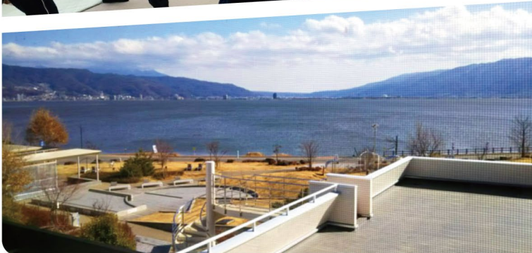
諏訪湖ハイツから見た諏訪湖 ▲