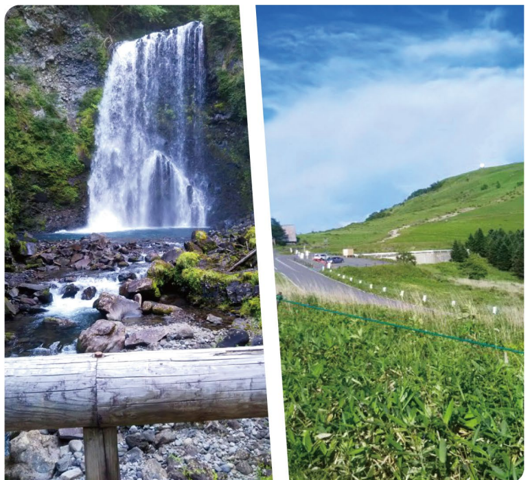
▲乗鞍高原の善五郎の滝

家からは八ヶ岳が見えて、天気のいい日には富士山も見えるので、雄大な自然に対して感謝の思いと畏敬の念を感じます。この自然をずっと次の世代まで残していきたいと思えます。個人としては、ゴミの持ち帰り、家では電気はこまめに消す、水は流しっぱなしにしない、食べ物は残さないなどに気をつけて生活しています。